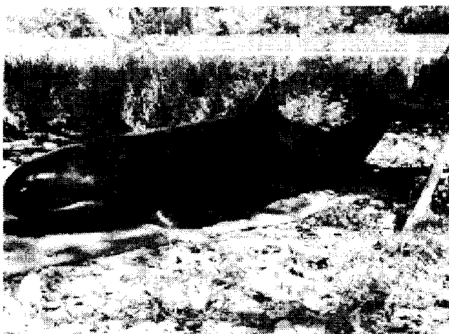
Figura 2 - Exemplar de Pseudorca crassidens que encalhou na Praia do Guajiru, Estado do Ceará, em julho de 2000.

O animal encalhado foi identificado como sendo da espécie Pseudorca crassidens . Ele apresentava o corpo com formato delgado e pouco comprimido nas laterais anteriores até a nadadeira dorsal, começando progressivamente mais comprimido na nadadeira caudal. A cabeça era oval e relativamente pequena, sem uma demarcação entre a melão e o rostro. A nadadeira era dorsal alta, falcada e posicionada um pouco atrás do ponto médio do dorso. Havia uma larga curva na extremidade anterior da nadadeira peitoral próximo ao centro (Figura 2). Esta descrição morfológica está de acordo com a descrição de P. crassidens feita por Leatherwood et al. (1982). A coloração do corpo variava desde cinza escuro a preto, com uma chama de luz cinza na superfície ventral entre as nadadeiras peitorais, característica observada por Fraser (1936), Tomilin (1957) e Leatherwood & Reeves (1983). O animal apresentava também oito grandes dentes cônicos em cada hemimaxila, dentro dos padrões citados por Reinhardt (1866) e Fraser (1936) que afirmam existir tipicamente de 8 a 10 grandes dentes cônicos em cada hemimaxila. As medidas biométricas do espécime estão indicadas na Tabela I.